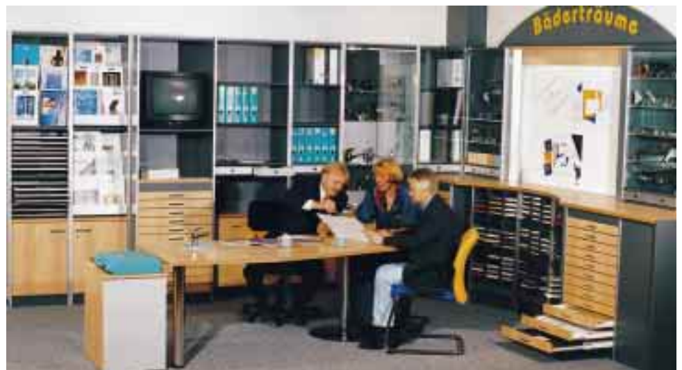
Der Collagenraum im Überblick. Kernstück ist das seitlich beleuchtete Whiteboard (r.), das sich bis zu 4750 mm ausdehnen kann. Für stets staubfreie Präsentationsprodukte sorgen Glasvitrinen. Mit dem TV-Schrankmodul mit Fliesen- oder Plancontainer (M.) lassen sich Videofilme vorführen

Das Fachhandwerk steht heute zweifellos für qualifizierte Beratung und hochwertige Produkte. Was zählt ist jedoch das klare Imageprofil, die Leistungsüberlegenheit gegenüber dem Baumarkt, welche im Bewußtsein des Verbrauchers bisher nicht deutlich genug verankert wurde. Hier gilt es anzusetzen. Mit einem Collagenraum-Konzept ist die Profilierung als Badspezialist beim Endverbraucher möglich. Erfolgreiche Unternehmen verdanken ihren Erfolg nicht großen Unterschieden, sondern Randunterschieden. Sie sind in wenigen, aber nach außen wirksamen Bereichen besser. Um diesen Vorsprung zu entwickeln, müssen Bäderbauer nicht völlig anders werden – nur ein bißchen besser in den Schlüsselbereichen, auf die es ankommt. Die Unterscheidung über Produktmerkmale ist heute kaum noch möglich. Der Wettbewerb wird über das Merkmal „Dienstleistung“ geführt und gewonnen. Ein Blick auf andere Branchen kann wertvolle Anregungen bringen. So gehört eine „Trendberatung“ in deutschen Küchenstudios schon lange zum Servicepaket. Weshalb soll diese Leistung nicht auch der Bäderbauer für seinen Bereich erbringen können. Schließlich bieten Messebesuche, spezielle Seminare und permanent aktuelle Herstellerinfos die Gewähr für das gefragte Trend-Know-