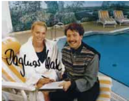
Mit der Schwimmerin Dagmar Hase lädt die Brückfeld KG seine Kunden zu einer Talk-Show ein

Dabei sind auch unorthodoxe Wege zum Kunden möglich. In sein neues „Kundenstudio Bad“ lädt das Bäderteam der Brückfeld KG in Magdeburg insgesamt zu fünf Veranstaltungen Kundinnen zu Tipper-Partys ein. Die Tipper-Repräsentantin nahm dieses Angebot gerne an. Die eingeladenen Damen erhalten im neuen Ambiente des Studios Informationen zu ihrem „Tagesgeschäft Küche“ und gleichzeitig Anregungen und Impulse für ein neues Traumbad. Die Tipper-Party ist nur ein einzelner Baustein aus dem umfangreichen Veranstaltungskonzept des hochinnovativen Unternehmens. So gibt es demnächst einen Infoabend „Der Euro kommt“ (mit einem versierten Bankfachmann), einen Fitness-Workshop, einen Trendabend „Schaufrisieren“ oder das jährliche VIP-Skatturnier für Geschäftspartner und wichtige Kunden. Daß die