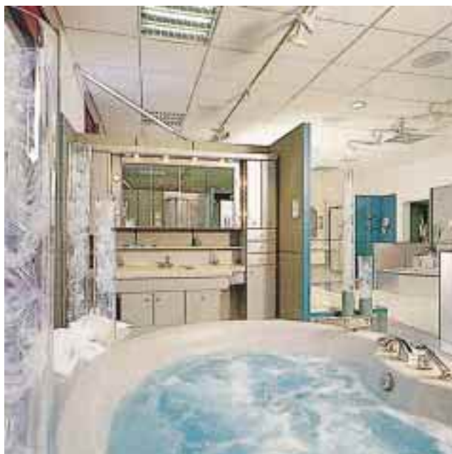
Ein „Whirlpool-Weekend“ bringt Kundenfrequenz ins Bäderstudio

Auch die Idee einer „Experten-Sprechstunde“ wird erfahrungsgemäß von zahlreichen Kunden genutzt. Auf einer ausgewiesenen Hotline werden den Kunden sofort Fachfragen beantwortet. Bieten Sie Ihren Kunden an einem Tag einen Spezialisten, beispielsweise einen Steuerberater am Telefon an, der kostenlos alle Fragen beantwortet.