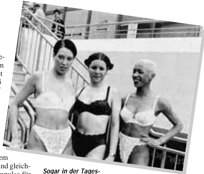
Sogar in der Tageszeitung vorgestellt: Drei junge Damen präsentierten den begeisterten Kunden des Bäderstudios Schuhmann in Ochsenfurt die neueste Bade- und Dessousmode

technologie, behindertengerechtes Bad, Regenwassernutzung, Fliesenlegerseminare und vieles mehr. Damit wird den Kunden ständig Neues und Interessantes demonstriert. Das aktive Unternehmen bleibt in seinem regionalen Gebiet permanent im Gespräch.