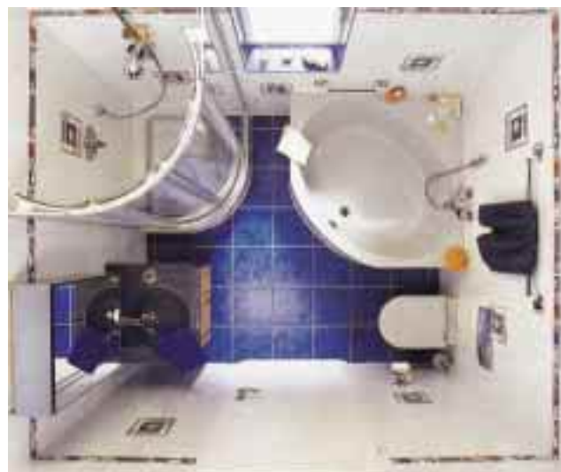
Weil die Mehrzahl der Deutschen mit kleinen Bädern auskommen muß, stoßen Infoabende zum Kleinbadkonzept auf große Resonanz

ums Bad“. Sieben der Interessenten hatten echten Bedarf und erhielten umgehend eine Planung mit Angebot. Bei einer Verkaufs-Abschlußquote von angenommenen 50 % brachte die Aktion drei Badaufträge.