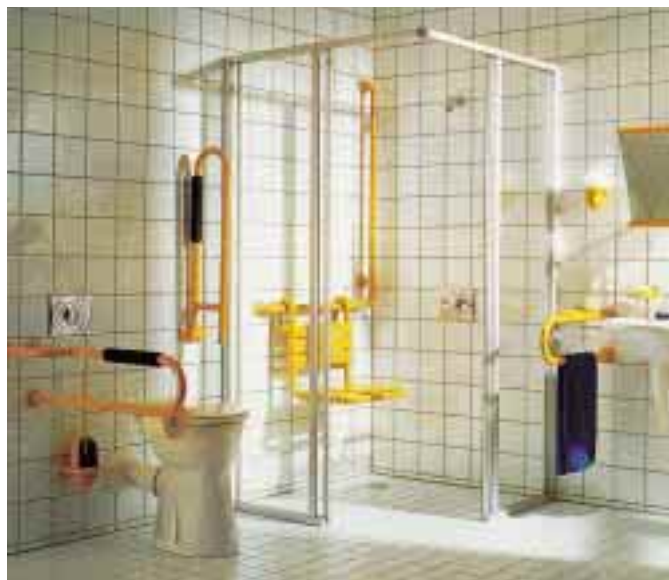
Zum Marketing-Repertoire der Kadel GmbH in Weinheim gehören auch Aktionstage zum Thema „behindertengerechtes Badezimmer“

Die Kadel GmbH in Weinheim geht ebenfalls neue Wege. Sie hat beispielsweise in ihrem Marketing-Repertoire ein Aktions- und Infotage-Paket mit den Themen Solar-