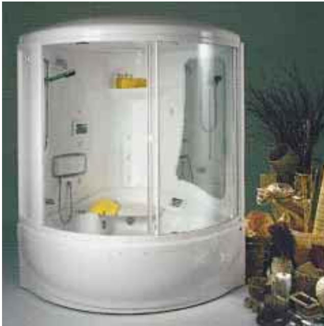
Wenn man den „ordinären Schausonntag“ unter ein besonderes Motto stellt (z. B. Dampfsauna-Treff), erregt die Veranstaltung mehr Aufsehen

ung und Entspannung. Und nach zwei Stunden geht es wieder zurück in den Alltag. Unternehmen sollten heute lernen querzudenken. Weshalb sollte ein Bäderbauer in seinen Räumen nicht eine Versteigerung durchführen? Wie viele Menschen hatten denn schon die Möglichkeit und das Vergnügen an einer entsprechenden Veranstaltung teilzunehmen? Wenn der Unternehmer als Schirmherrin noch die Frau des Bürgermeisters einlädt, ist eine Spitzenresonanz gewiß.