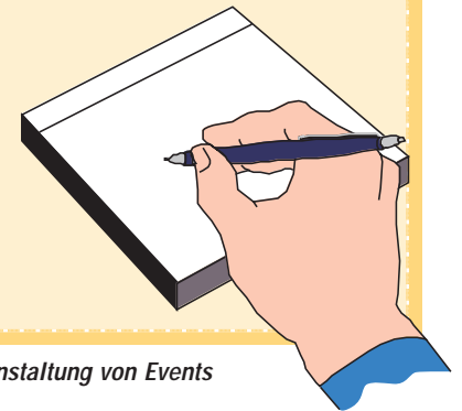
Checkliste für die Veranstaltung von Events

man wichtigen Zusatznutzen. Mit Information, Unterhaltung und Beratung aktiviert man neue Interessenten für sein Bad-Angebot.