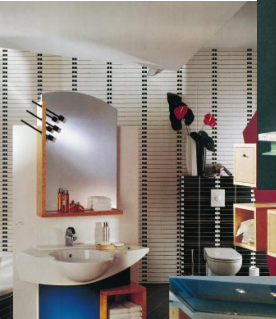
Für die Serie „Lavillette“ übertrug der Designer Dieter Sieger die Ideale der dekonstruktivistischen Architektur vom Bauwerk aufs Bad-Design

Bäderbauer sollten keine Scheu vor neuen Themen haben. Wenn es um Gestaltungsfragen und Einrichtungs-Know-how geht, braucht man vor allem Raumgefühl, Gespür für Farben und Mut zum Ausprobieren. Bäderbauer sollten bereit sein, sich ständig weiterzuentwickeln. Die ersten Gewehre mußten so lange zum Schuß vorbereitet werden, daß Pfeil und Bogen zwölfmal schneller waren. Es ist also durchaus vernünftig, sich langsam an die Gestaltung von Themenbädern heran zu treten. Am Beispiel eines Dekonstruktivismus-Badezimmers wird erkennbar, wie einfach und schnell ein Thema umgesetzt werden kann.