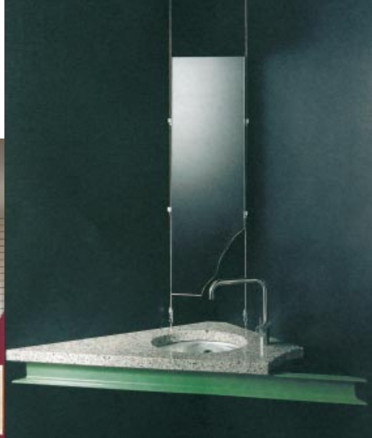
Ein funktionelles Kunstobjekt. Die gebrochene Natursteinplatte, der unverkleidete Eisenträger und der deformierte Spiegel sind Ausdruck des Dekonstruktivismus. Die puristische Armatur beruhigt die Szenerie

Im modernen Bäderstudio der Magdeburger Brückfeld KG sind vor allem Themenbäder (hier eine dekonstruktivistische Koje) das Unterscheidungsmerkmal zum Wettbewerb